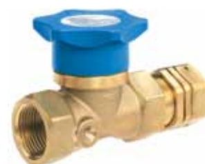
BI x wartelmoer blind