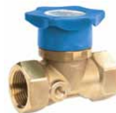
BI x BI blind