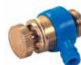
Buitendraad met verdraaibare uitloop Max. temp. 90°C