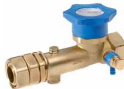
Kraan met wartelmoer x BI met aftapper, EA beveiliging en geïntegreerde schuifkoppeling