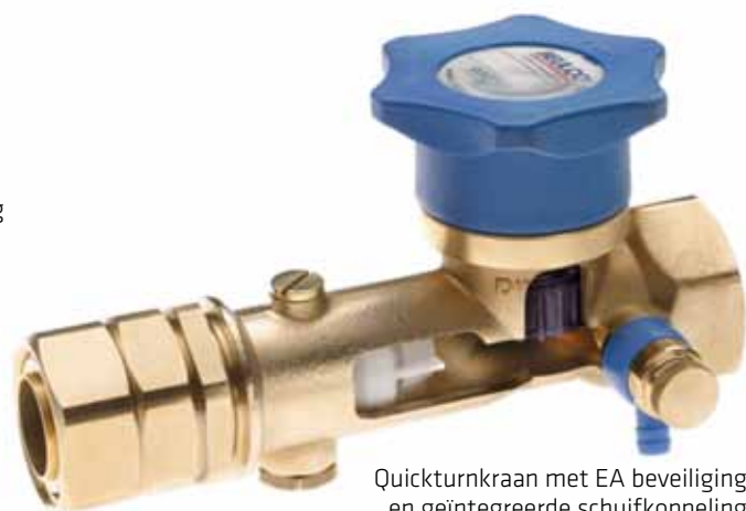
Quickturnkraan met EA beveiliging en geïntegreerde schuifkoppeling