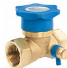
BI x BI met aftapper